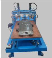
제품 자동 센터링 미친