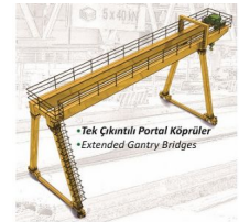
• Tek Çıkıntılı Portal Köprüler • Extended Gantry Bridges