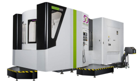
Ürün cnc su fırın işleme merkezi