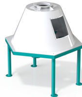
Ürün Diğer Makine