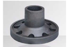
제품 잠수정 모터