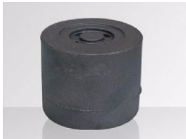
제품 잠수정 모터