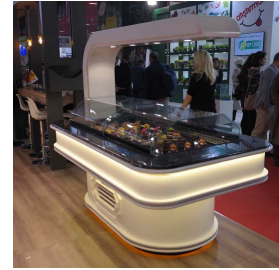
ürün Pasturasyon Bölümü