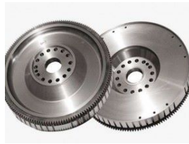
Ürün Krank Döndürme