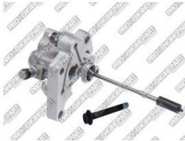
Ürün Yakıt Pompası