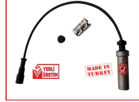
제품 ABS 센서