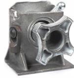
제품 Döküm Kilit