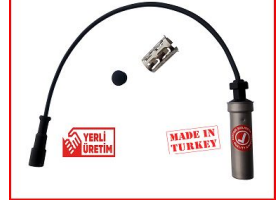
제품 ABS 센서