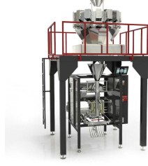
Ürün BM-W ÇOKLU ELEKTRONİK TERAZİLİ PAKETLEME