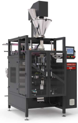
Ürün IMQ-A VİDALI QUADRO PAKETLEME MAKİNESİ