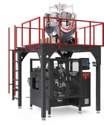
Ürün IM-W ÇOKLU ELEKTRONİK TERAZİLİ PAKETLEME