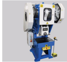
Ürün CNC Hidrolik Pres