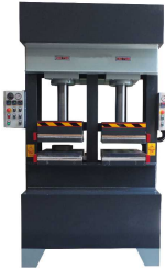
제품 유압 프레스 기계