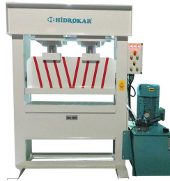
제품 유압 프레스 기계