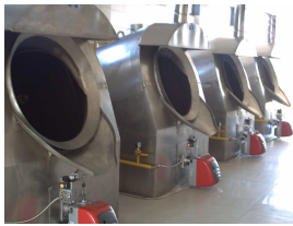
Ürün Çam fıstığı roasting makinesi