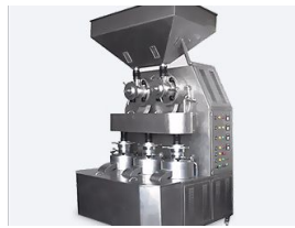
Ürün Çam fıstığı öğütme makinesi