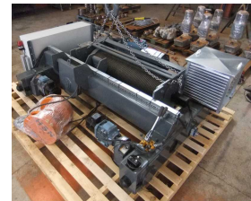
Ürün Tekerlekli Hoist