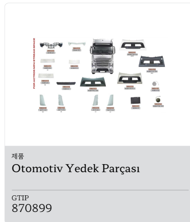
Ürün Otomotiv Yedek Parçası