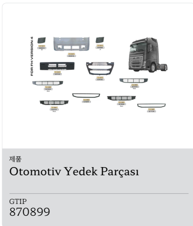
Ürün Otomotiv Yedek Parçası