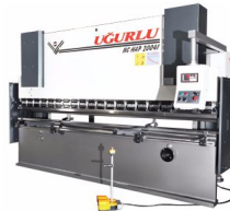
Ürün CNC Hidrolik Pres