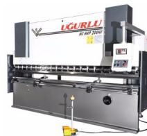
Ürün CNC Hidrolik Pres