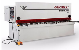
Ürün CNC Hidrolik Kılavuz