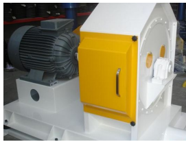
Ürün Un Sievesi