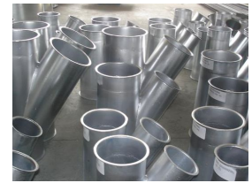
Ürün Emiş Boruları