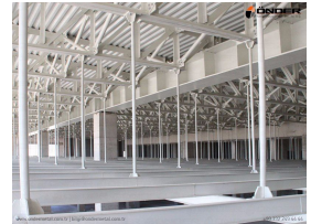
Çalıştırılan Ürünler Çelik Yapı