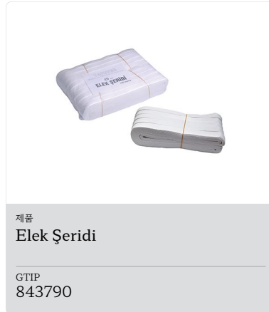
Ürün Elek Şeridi