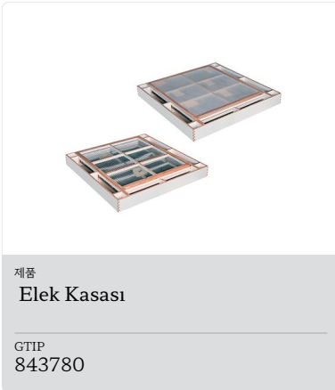
Ürün Elek Kasası