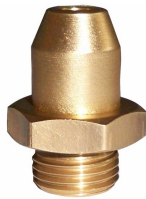
Ürün Hidrolik hortlu adaptör