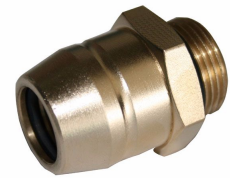
Ürün Hidrolik hortlu adaptör