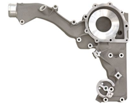
제품 Devirdaim Kapak