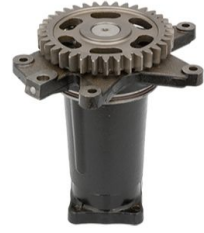
제품 팬 하우징