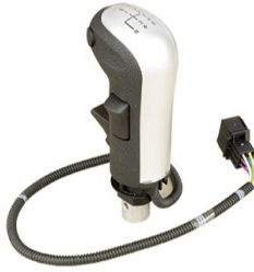
제품 기어 손잡이