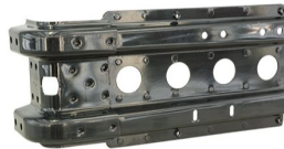
제품 머드가드 연결