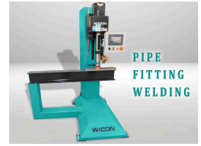
PIPE FITTING WELDING