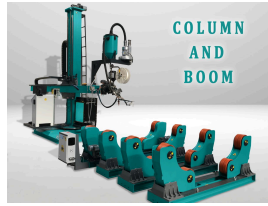
COLUMN AND BOOM