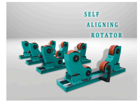
SELF ALIGNING ROTATOR