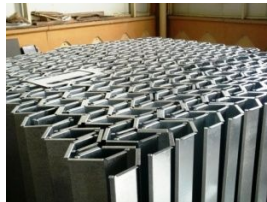
Ürün Şit Çizim - Kırma