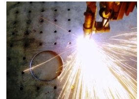
Ürün Plazma Çizim