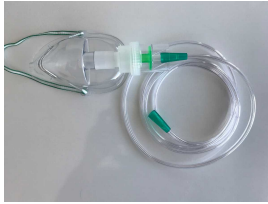
Ürün Nebulizatör Seti