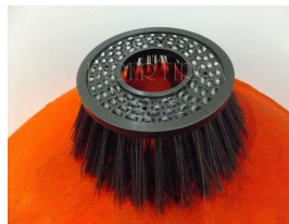
Продукт. Стальная щетка