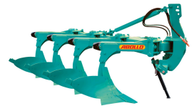
Ürün HİDROLİK AYARLANABİLİR TAM OTOMATİK PULLUK