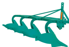
Ürün SOKLU PULLUK