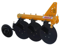
Ürün ABOLLO DİSKLİ PULLUK