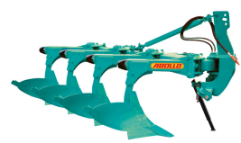
Ürün HİDROLİK AYARLANABİLİR TAM OTOMATİK PULLUK