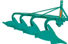
Ürün ABOLLO SOKLU PULLUK