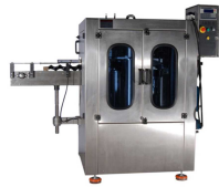
Ürün Geri Dönüşüm Makinası