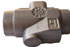
Ürün Hidrolik Paras