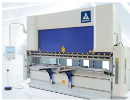
Ürün Hidrolik Pres