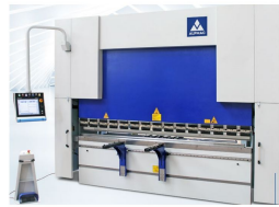
Ürün Hidrolik Pres