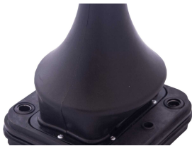
Ürün Plastik Kauçuk