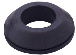
Ürün Plastik Kauçuk