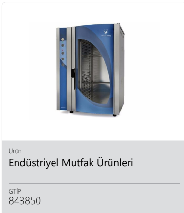
Ürün Endüstriyel Mutfak Ürünleri