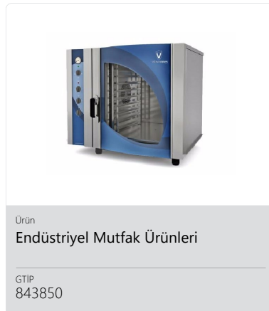
Ürün Endüstriyel Mutfak Ürünleri