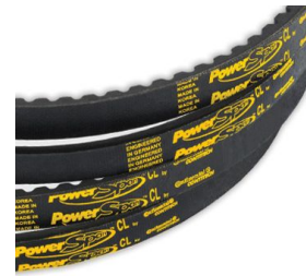
Ürün V Kayışı