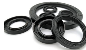
Ürün Keçe Yatağı