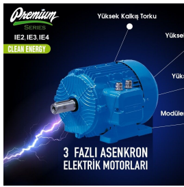
Ürün Endüstriyel Motor