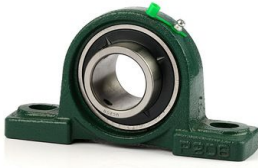
Ürün Yataklı Rulman