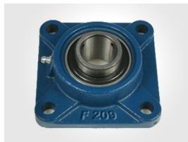
Ürün Ucf Yatak