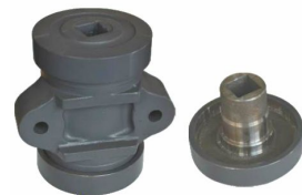
Ürün Vanvey Yatak