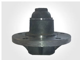
Ürün Römork Poryası