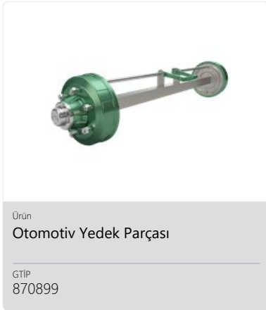
Ürün Otomotiv Yedek Parçası