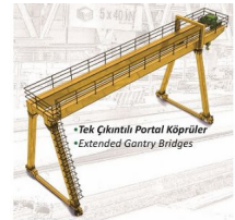
• Tek Çıkıntılı Portal Köprüler • Extended Gantry Bridges