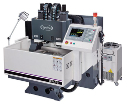
Ürün Cnc Dik İşleme Merkezi