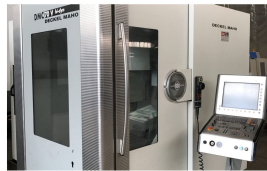
Ürün Cnc İşleme Merkezi