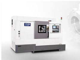
Ürün Torna Tezgahı