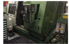
Ürün Cnc Torna