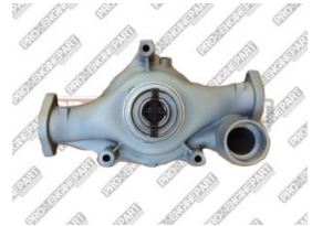
Ürün Su Pompası