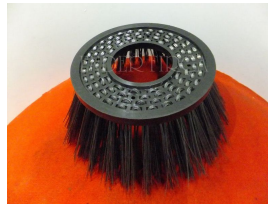
Ürün Çelik Fırça