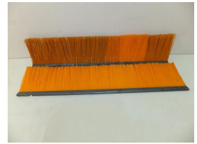
Ürün Tarak Fırça