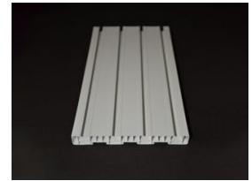
Ürün Perde Rayı / Korniş