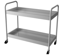
Ürün Servis Arabası