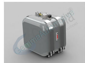
Ürün Yağiyim Deposu