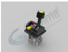
Ürün Pnömatik Kontrol