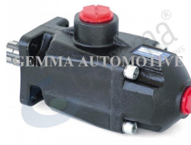
Ürün Pistonlu Pompa