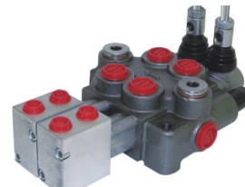
Ürün Yön Valfi