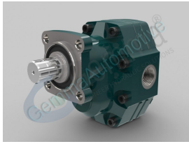
Ürün Hidrolik Disli Pompa