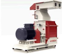
Ürün Çekiçli Değirmen