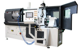
Ürün SİRAYET (ROVELVER) HIZLI TORNA