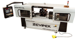
Ürün 2 EKSEN AHŞAP CNC MAKİNESİ