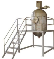
Ürün Reçel Kaynatma Kazanı