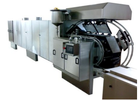
Ürün Gofret Pişirme Fırını