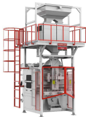
Ürün BM-XL Lineer Terazili Paketleme Makinesi