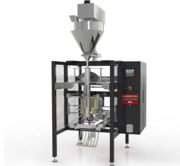
Ürün Bm-a Vidalı Paketleme Makinesi