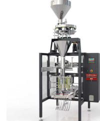
Ürün Bm-v Volumetrik Paketleme Makinesi