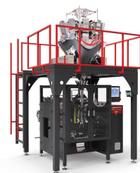
Ürün CM-W ÇOKLU ELEKTRONİK TERAZİLİ PAKETLEME MAKİNESİ