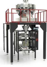
Ürün BM-W ÇOKLU ELEKTRONİK TERAZİLİ PAKETLEME MAKİNESİ