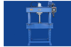
Ürün Hidrolik Pres