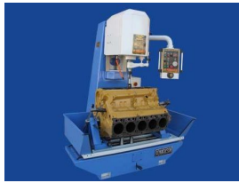
Ürün Hidrolik Honlama Makinası