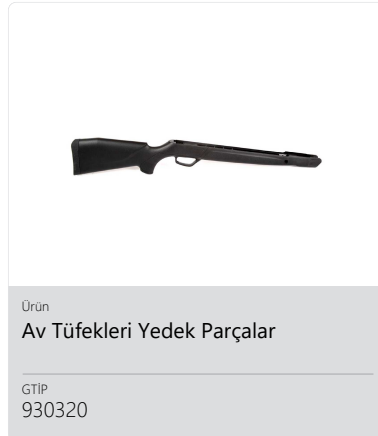
Ürün Av Tüfekleri Yedek Parçalar