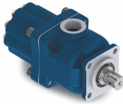
Ürün Hidrolik Pompa