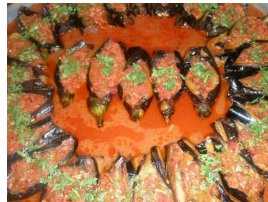
Ürün Tabildot Günlük Menü