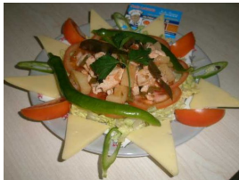
Ürün Tabildot Günlük Menü