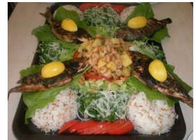
Ürün Tabildot Günlük Menü