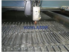
Ürün Cnc Metal Kesim