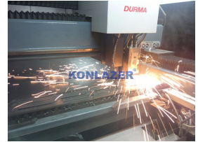
Ürün Cnc Metal Kesim